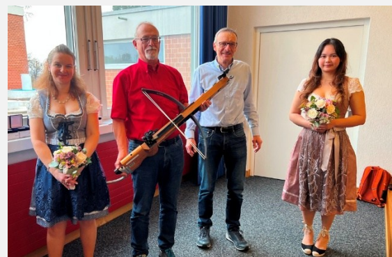
... und für den Sieg in der Sektions-Wertung entgegen nehmen.