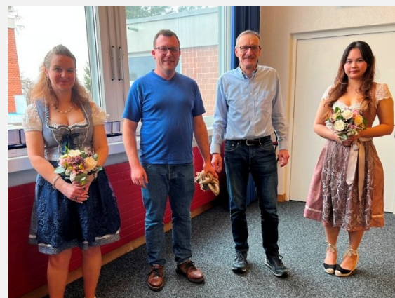
Der Polysportiv-Sieg ging an den Nachwuchs von Turbenthal.