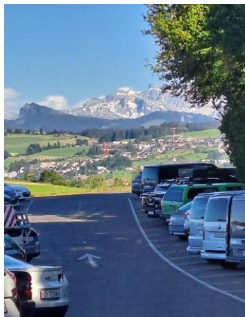
Schönes Panorama auf den Glärnisch und warmes Wetter zum Schiessen.

Auch für das leibliche Wohl der Teilnehmenden war gesorgt: Jeder Teilnehmer erhielt einen Bon für eine Wurst, die von den Grilleuren des SVW zubereitet wurde. Weitere Resultate und Informationen sind auf der Homepage des Schützenvereins Wädenswil unter www.svwaedenswil.ch abrufbar.