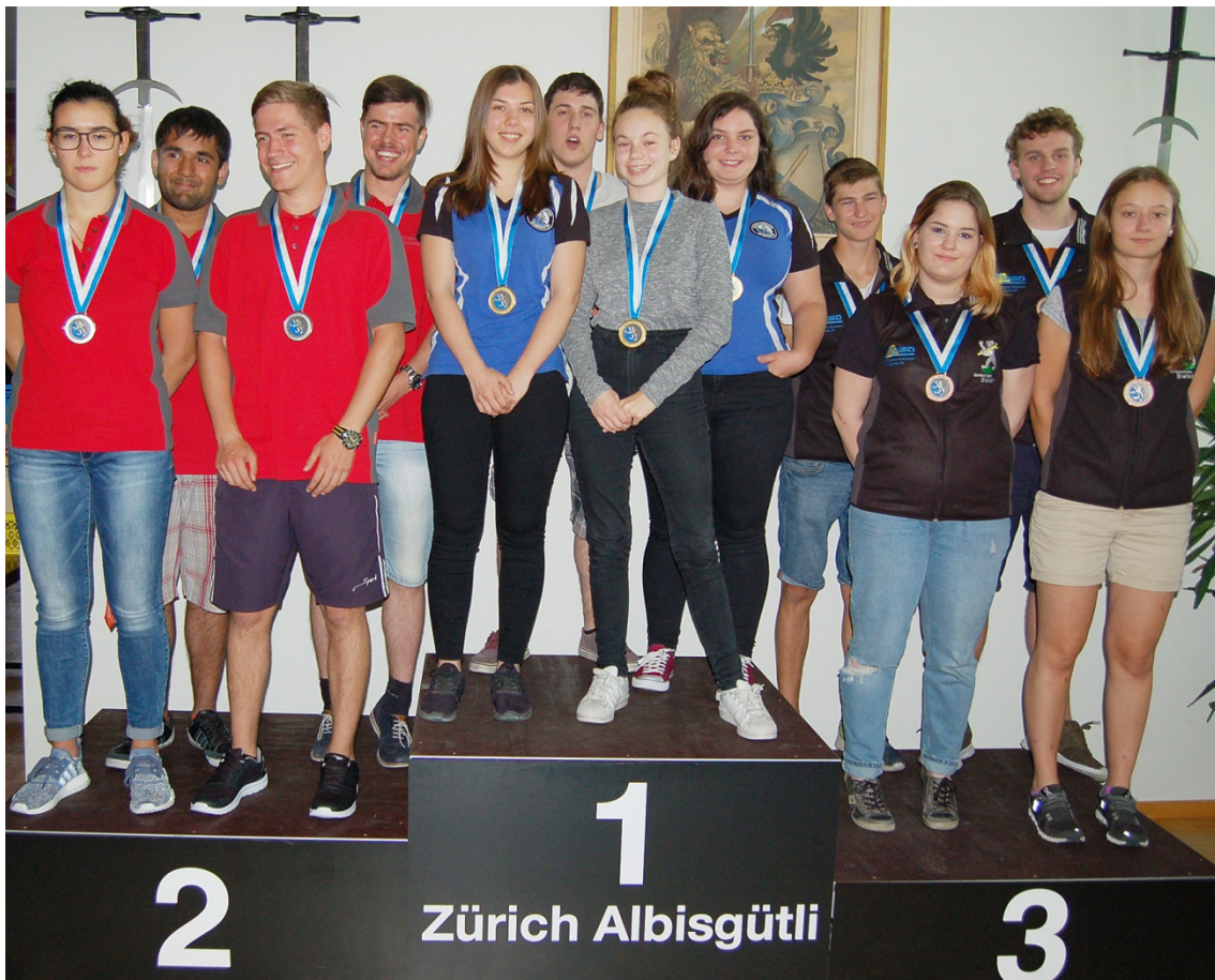
Das Podest mit den Medaillengewinnern der Junioren: 1. Zürich Neumünster 1488 (744/744). 2. Winterthur Stadt 1487 (741/746). 3. Dielsdorf I 1486 (752/734).