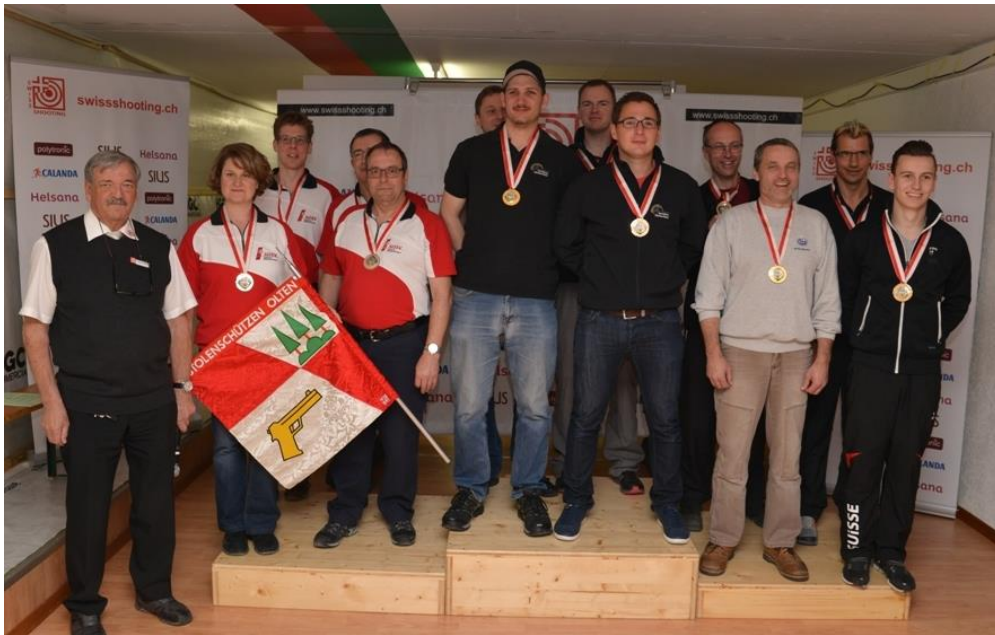
1. Schmitten-Flamatt 2. Olten 3. Teufen

Die Schiessanlage Thurau in Wil war am 1. April Schauplatz des Finals der Schweizer Gruppenmeisterschaft Pistole 10m. In spannenden Wettkämpfen konnte sich nach einem Halbfinal mit 40 und einem Final mit 24 Schuss bei der Elite das Quartett aus Schmitten-Flamatt durchsetzen. Die Gruppen aus dem Zürcher Verband mussten die Heimreise ohne Medaille antreten.