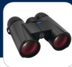
3. Preis/3 e prix