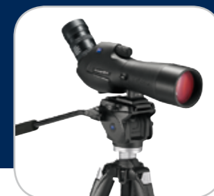
1. Preis/1 er prix