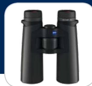
2. Preis/2 e prix