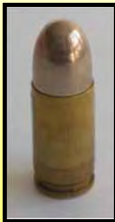
9mm Pist Pat 41