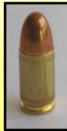
9mm Pist Pat 14 Police Target