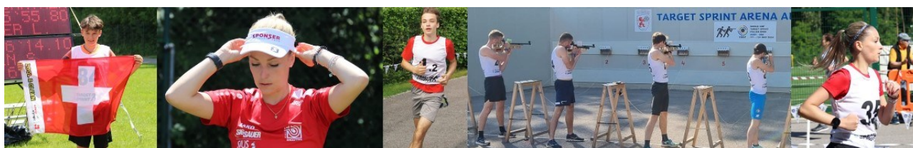
Text: Markus Roth

Vom 18. bis 19. Mai 2024 reisten fünf Schweizer Target Sprint Athletinnen und Athleten an den Weltcup nach Auer/Ora (Italien), um sich nach dem im April in Hódmezővásárhely (Ungarn) durchgeführten Grand-Prix in einem weiteren internationalen Wettkampf mit der Weltspitze zu messen.