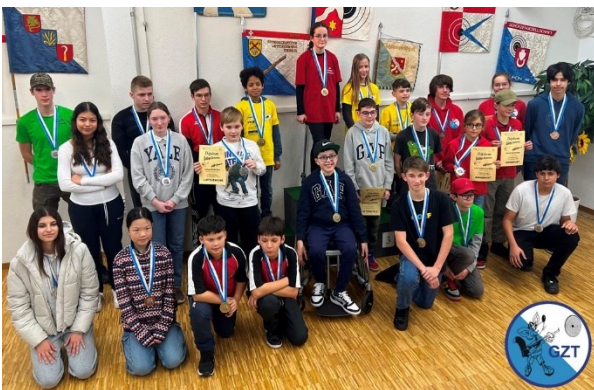
Alle Medaillengewinnerinnen und Medaillengewinner.

Getreu dem Motto: «Du musst nicht erfolgreich sein, um zu beginnen – aber Du musst beginnen, um erfolgreich zu werden!» lieferten sich die jungen Athletinnen und Athleten faire und interessante Wettkämpfe.