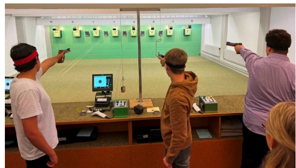
Erfreuliche Zunahme bei der Luftpistole.

Besonders erfreulich war die Zunahme der Teilnehmerzahl in der Disziplin «Luftpistole». Mit 249 Teilnehmerinnen und Teilnehmern in den von den Vereinen durchgeführten Heimrunden war die Teilnehmerzahl seit 2018 nie mehr so hoch und konnte gegenüber den Vorjahr um 19 jugendliche Sportschützinnen und Sportschützen gesteigert werden.